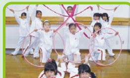
ジュニア新体操教室

※入会時に別途、事務手数料1,650円が必要となります。※オークスバリュークラブサービス開始後2ヶ月間の加入が条件となります(月額550円) ※4ヶ月間の在籍が条件となります。