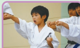
ジュニア空手教室