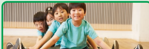
ジュニア体操教室