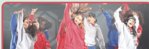
エイベックスダンスマスター