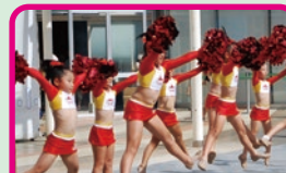
ジュニアチアダンス教室